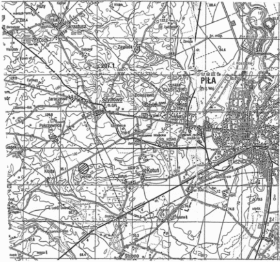
Lokalizacja Skala 1 : 100 000

Przedsiębiorstwo Geodezyjne i Kartograficzne INVEST GEO Inż. Adam Marchach 77-430 KRKAJENKA ul. Wł. Jagiełły 22, tel. (057) 253-80-22 Regon 14082281 NIP 764-144-90-72