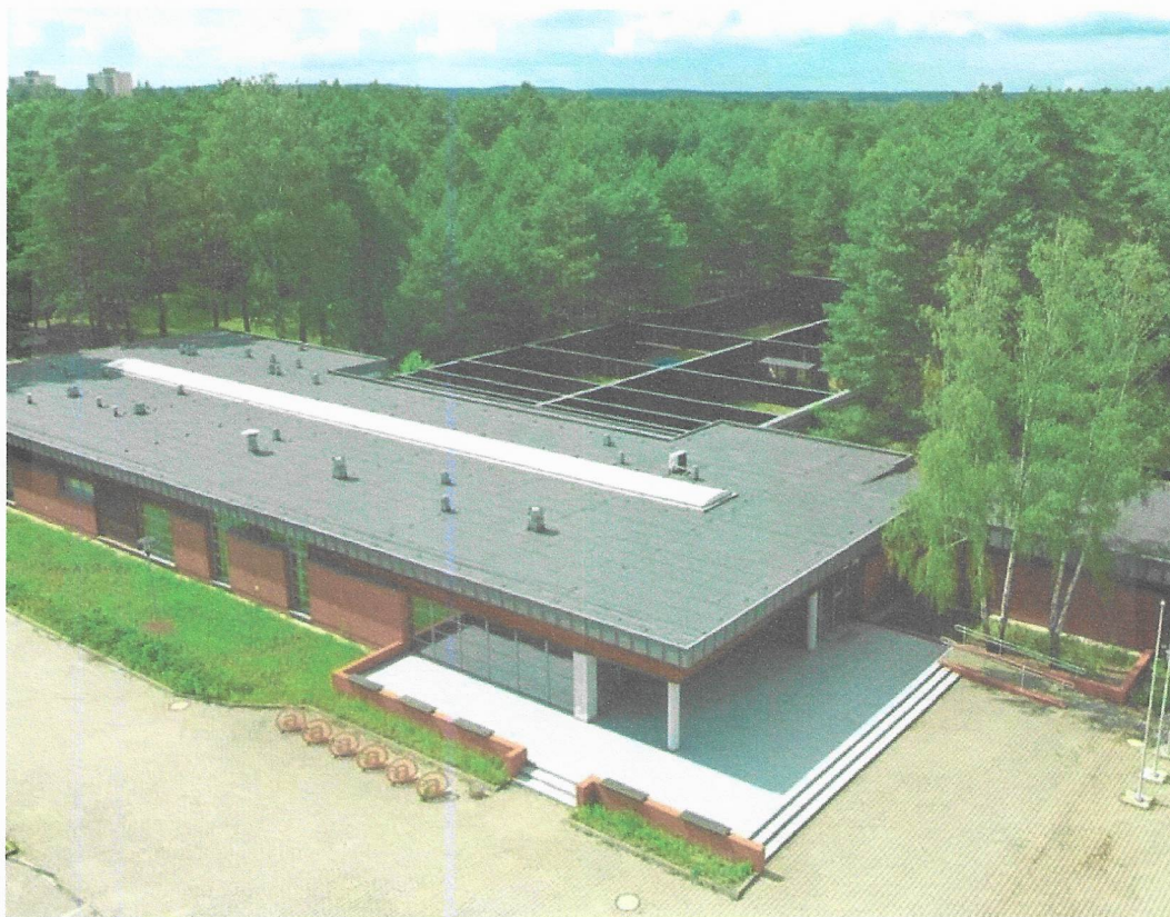
Widok z góry budynku administracyjnego CSS „Tarcza” w Pile