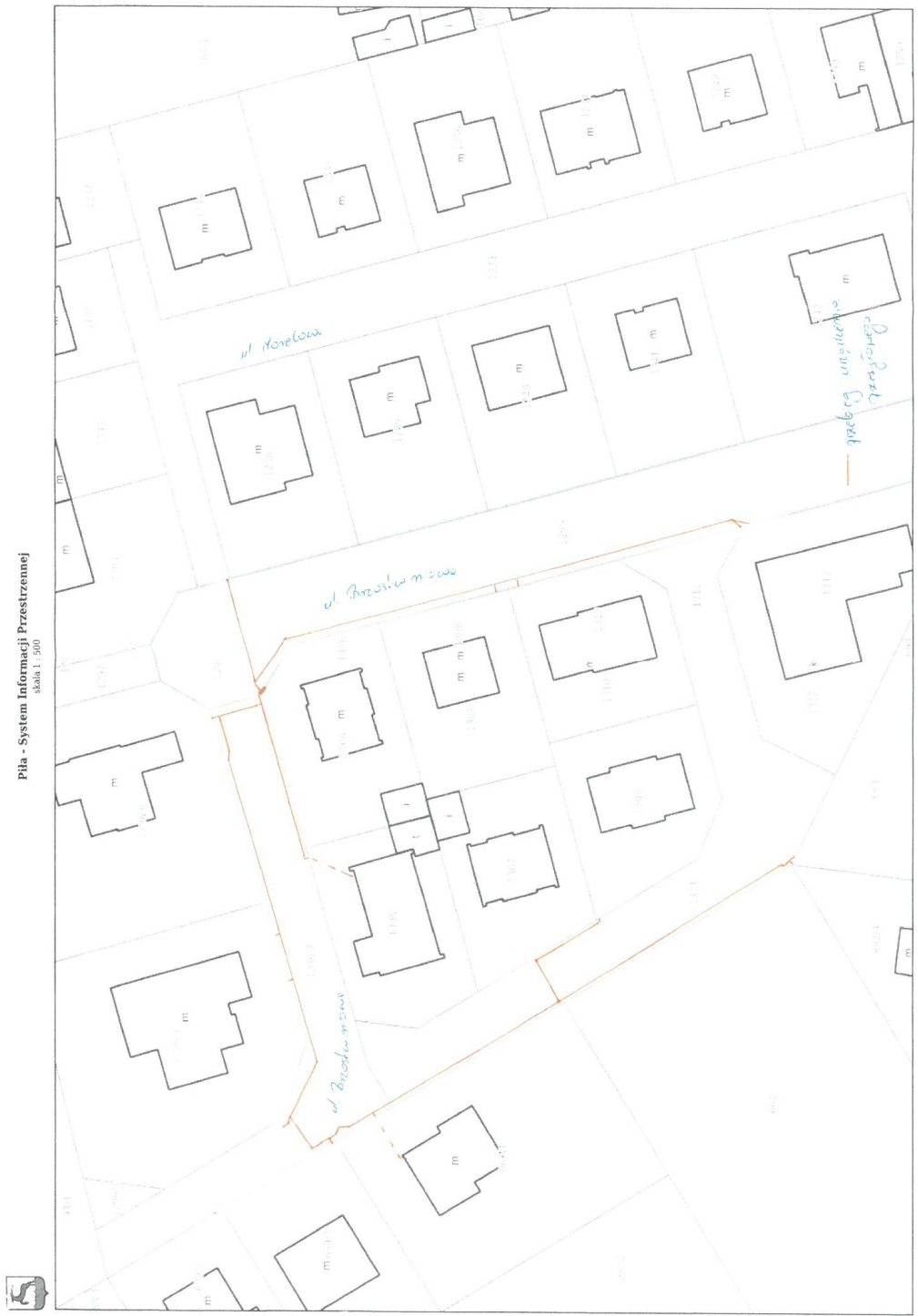
Pila - System Informacji Przestrzennej skala 1 : 500