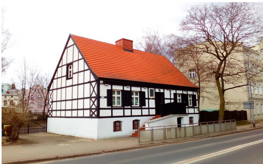
Dom Stanisława Staszica. Obecnie siedziba muzeum jemu poświęconego

Opisując stan zachowania najcenniejszych zabytków Piły, należy skupić się na obiektach wpisanych do rejestru zabytków, gdyż siłą rzeczy są one najcenniejszymi dla dziedzictwa kulturowego miasta: