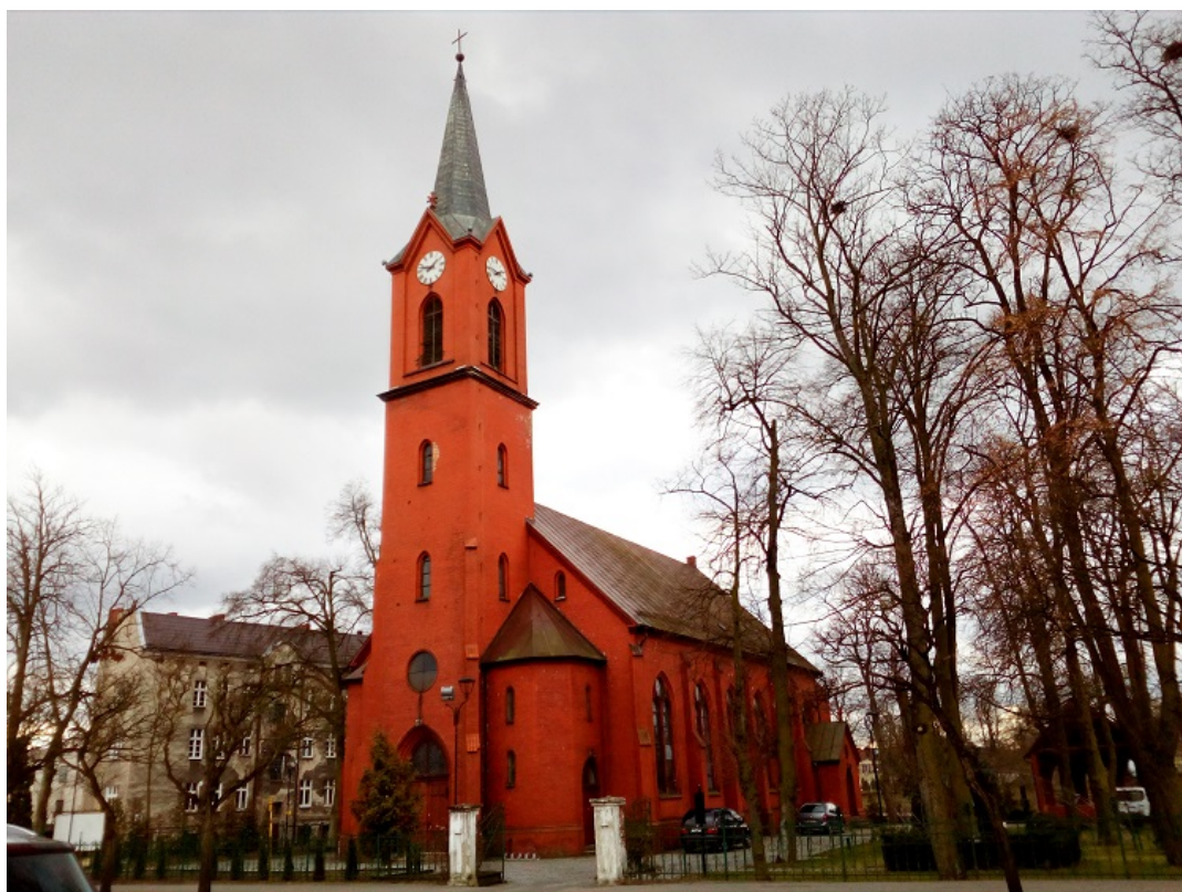
Kościół pw. św. Stanisława Kostki przy ul. Browarnej