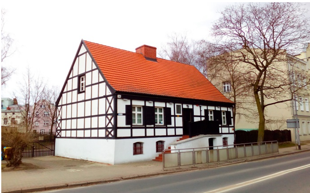
Dom Stanisława Staszica. Obecnie siedziba muzeum jemu poświęconego

Opisując stan zachowania najcenniejszych zabytków Piły, należy skupić się na obiektach wpisanych do rejestru zabytków, gdyż siłą rzeczy są one najcenniejszymi dla dziedzictwa kulturowego miasta: