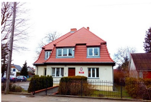
Willa z ogrodem

przedszkole. Następnie, po przeprowadzonym remoncie, w budynku utworzono siedzibę Delegatury w Pile Wielkopolskiego Wojewódzkiego Konserwatora Zabytków, którą to funkcję obiekt spełnia po dziś dzień. Stan obiektu wraz z otoczeniem jest dobry.