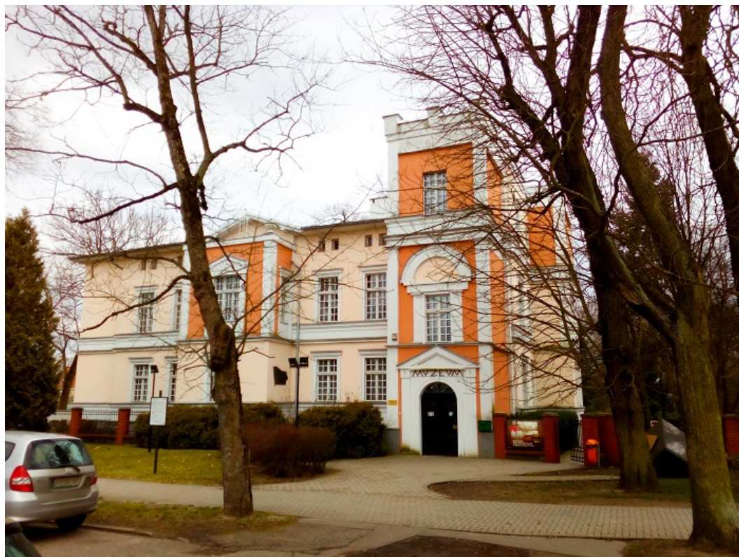
Dawny Konsulat RP. Obecnie Muzeum Okręgowe im. Stanisława Staszica w Pile

wojskowego. W późniejszych latach mieściła się w nim siedziba najpierw Sądu Grodzkiego, a następnie Sądu Rejonowego. W roku 1969 obiekt przeszedł kolejną rozbudowę, a po przeniesieniu siedziby sądu do innej lokalizacji, budynek dawnego Konsulatu RP gruntownie odrestaurowano.