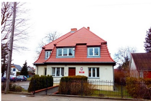
Willa z ogrodem

przedszkole. Następnie, po przeprowadzonym remoncie, w budynku utworzono siedzibę Delegatury w Pile Wielkopolskiego Wojewódzkiego Konserwatora Zabytków, którą to funkcję obiekt spełnia po dziś dzień. Stan obiektu wraz z otoczeniem jest dobry.