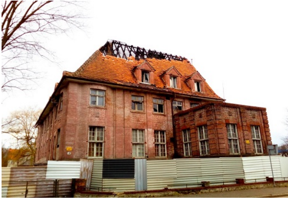
Budynek Miejskiej Kasy Chorych. Widoczne uszkodzenia dachu po przebytych pożarach

Jego stan dodatkowo pogorszył przebyty w maju 2017 pożar, który znacząco uszkodził więźbę dachową. Właściciel nieruchomości został zobowiązany przez Wielkopolskiego Wojewódzkiego Konserwatora Zabytków do zabezpieczenia budynku przed dalszym niszczeniem, lecz obecnie prace nie zostały jeszcze wykonane. Jego stan zachowania można określić zdecydowanie jako zły, obiekt wymaga gruntownego remontu.