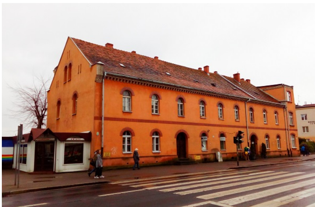
Budynek dawnego arsenału

zachowany widok obiektu zawdzięczamy litografii Napoleona Ordy z II połowy XIX w. W trakcie walk w roku 1945 budynek został poważnie zniszczony, jednak w roku 1947 powołany Komitet Odbudowy Domu Stanisława Staszica w Pile rozpoczął starania o odbudowę obiektu, którą ukończono w roku 1948, jednak nie zachowano jego pierwotnej, szachulcowej konstrukcji elewacji. Pierwotny wygląd przywrócono zabytkowi dopiero w trakcie gruntownego remontu, jaki obiekt przeszedł w latach 1985-1986, wzorując się na wspomnianej litografii N. Ordy. Obecnie obiekt objęty jest ochroną na podstawie wpisu do rejestru zabytków i od wielu lat stanowi siedzibę Muzeum Stanisława Staszica w Pile. Sam obiekt jest własnością Gminy Piła. Stan budynku jest ogólnie dobry, jednak odświeżenia wymagają pomieszczenia gospodarcze, a modernizacji instalacja sanitarna. W najbliższych latach planowany jest remont i modernizacja muzeum, jednak czas ich realizacji może wykroczyć poza ramy czasowe niniejszego programu.