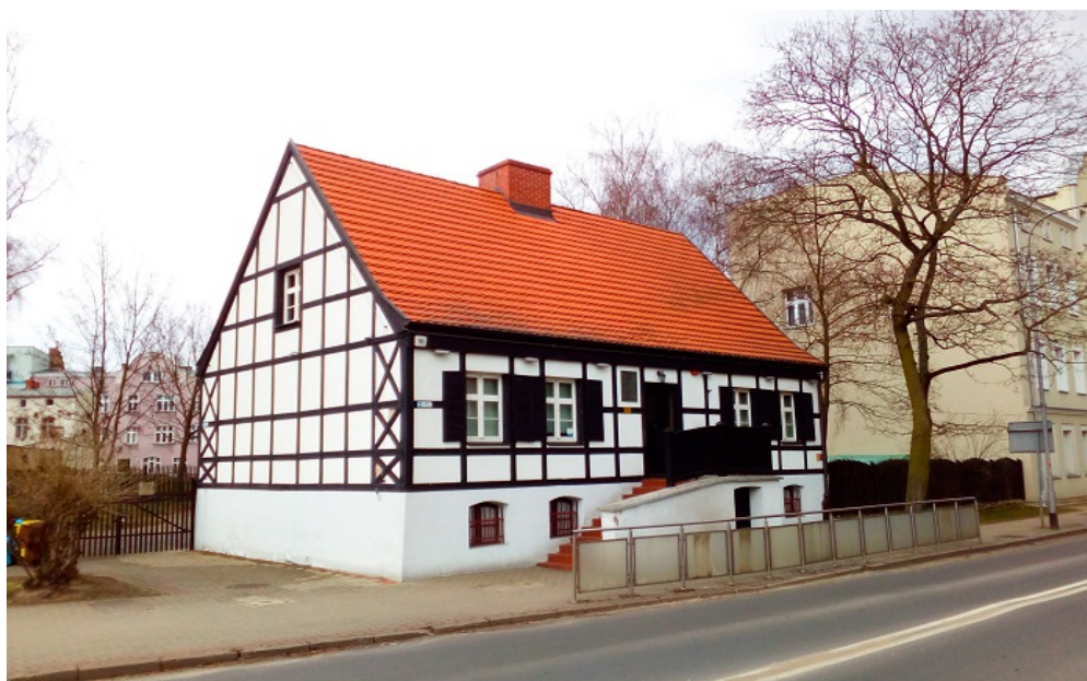
Dom Stanisława Staszica. Obecnie siedziba muzeum jemu poświęconego

Opisując stan zachowania najcenniejszych zabytków Piły, należy skupić się na obiektach wpisanych do rejestru zabytków, gdyż siłą rzeczy są one najcenniejszymi dla dziedzictwa kulturowego miasta: