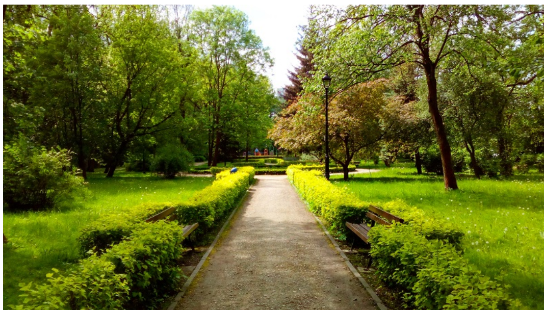
Jedna z alejek w północnej części parku

połączone w jeden kompleks. W roku 1955, z okazji 200 rocznicy urodzin Stanisława Staszica, park otrzymał oficjalną nazwę „Park Miejski im. Stanisława Staszica”. Niestety, już w okresie powojennym zniszczeniu uległa muszla koncertowa, a także istniejące przed wojną rosarium. W połowie lat 70-tych, podczas budowy al. Wojska Polskiego od parku odcięty został jego południowy fragment, znajdujący się między budowaną aleją, a dzisiejszą ulicą Spacerową. Na terenie parku, do czasów współczesnych udało się zachować kilka cennych elementów, głównie małej architektury. W samym centrum kompleksu, nad malowniczym stawem, wznosi się żelazna secesyjna altana z 1904 roku. W północno-wschodniej części parku znajduje się fontanna pochodząca z czasów rozbudowy parku w latach 20-tych XX w. Z tego też okresu pochodzi 6 murowanych mostków przerzuconych nad strumieniem i stawem. Warto wspomnieć także o ustawionej obok altany efektownej replice stylowych, przedwojennych latarni znajdujących się w Pile. W najbardziej reprezentacyjnej części parku stoi obecnie brązowe popiersie Stanisława Staszica, dłuta rzeźbiarza Andrzeja Lejszysa. W roku 2001 przy głównym wejściu do parku odsłonięto obelisk zwieńczony kulą ziemską, poświęcony Byłym - obecnym - przyszłym pilanom . Na pomniku umieszczono m.in. przedwojenny i obecny herb Piły oraz herb Cuxhaven - miasta, w którym mieszka większość przedwojennych pilan, a które jest miastem partnerskim Piły.