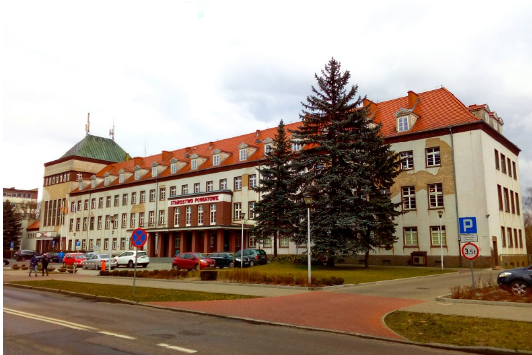
Dom Krajowy. Obecnie siedziba Starostwa Powiatowego w Pile