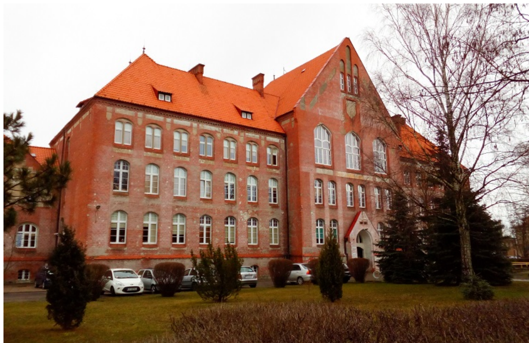
Zespół Seminarium Nauczycielskiego. Obecnie Szkoła Podstawowa nr 7 im. Adama Mickiewicza w Pile

W chwili obecnej prowadzony jest remont peronu III z uwagi na konieczność jego dostosowania do wyremontowanej linii kolejowej Piła-Poznań.