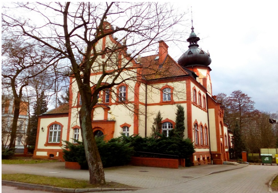
Budynek dawnego kasyna oficerskiego. Obecnie wystawiony na sprzedaż

sprzedany osobie prywatnej, a w roku 1996 zakupiony przez Invest-Bank. Wtedy też, w latach 1996-1998 obiekt został gruntownie wyremontowany i stanowi do dzisiaj jedną z najbardziej charakterystycznych oraz okazałych architektonicznie budowli w Pile.