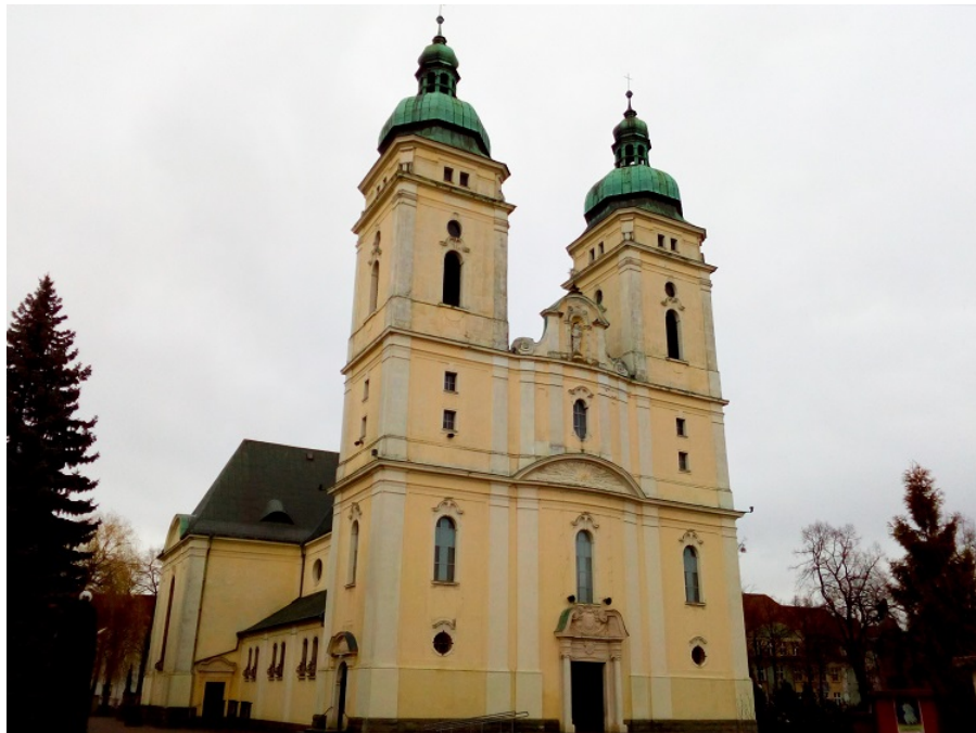
Neobarokowy kościół pw. Świętej Rodziny

1915 roku świątynia została konsekrowana i od tego momentu oficjalnie pełniła funkcję katedry administracji apostolskiej, tzw. "Prąfatury Piłskiej", przeniesionej do Piły z Tuczna w roku 1926. Kościół wybudowano w stylu neobarokowym, na planie krzyża. Jest to konstrukcja z cegły, na kamiennych fundamentach. Portale,