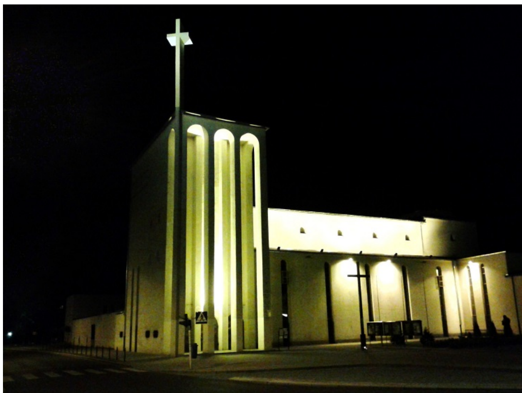
Kościół pw. św. Antoniego o charakterystycznej, modernistycznej architekturze

Kościół, jako świątynia przyklasztorna, posiada kontemplacyjne w wyrazie, katakumbowe wnętrze. Całość zaprojektowano i wybudowano w stylu modernistycznym, charakterystycznym dla lat 20-tych i 30-tych XX wieku. Styl ten w budownictwie sakralnym, zwłaszcza w swojej niemieckiej wersji, częściowo nawiązuje do wczesnego stylu romańskiego ze swoją masywną i uproszczoną formą. Tak jest też w przypadku omawianego obiektu. Warto wspomnieć, że wnętrze budynku zdobi 7-metrowa figura Ukrzyżowanego Chrystusa, wykonana