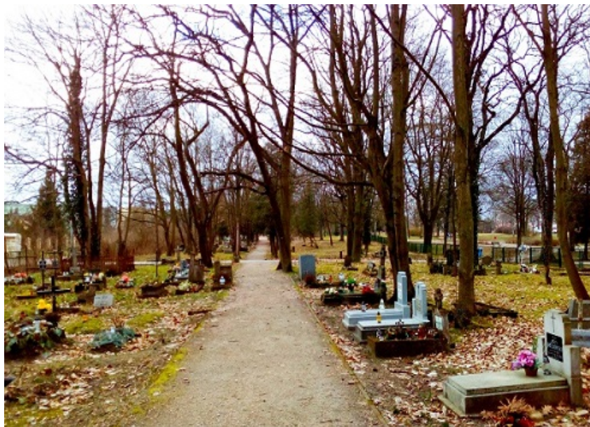
Cmentarz przy ul. Asnyka