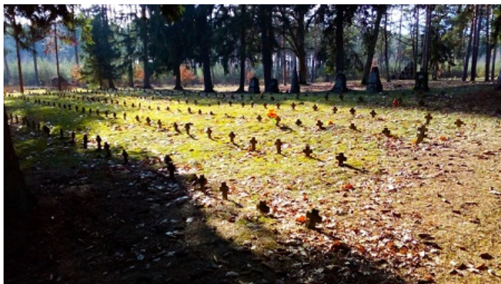
Cmentarz jeniecki z czasów I wojny światowej

zmarłych w obozie jenieckim zlokalizowanym na terenie Piły. Cmentarz ten także jest własnością skarbu państwa, a Gmina Piła jest jego zarządcą.