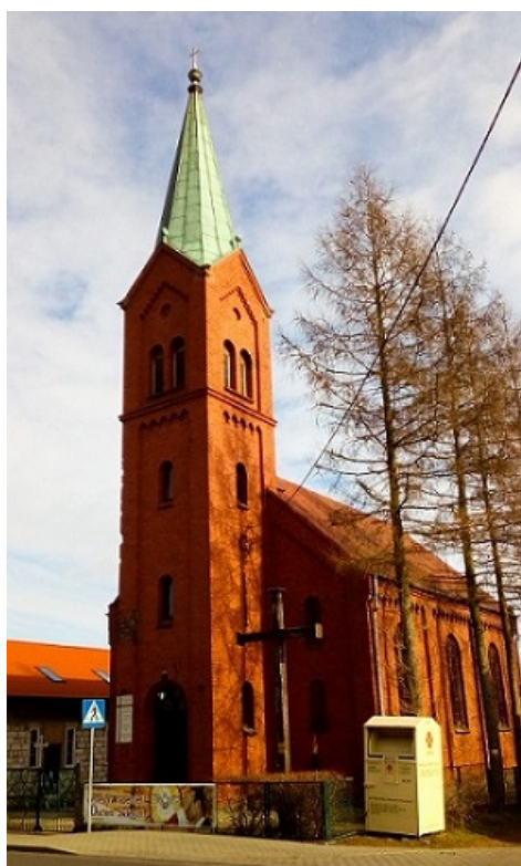
Kościół pw. Matki Bożej Częstochowskiej

obiektem sakralnym w Pile. Zaprojektowany i wybudowany w stylu neogotycko-neoromańskim. Pierwotnie kościół stanowił filię parafii ewangelicko-augsburskiej w Pile, jednak już w 1892 roku zyskał rangę samodzielnego kościoła parafialnego.