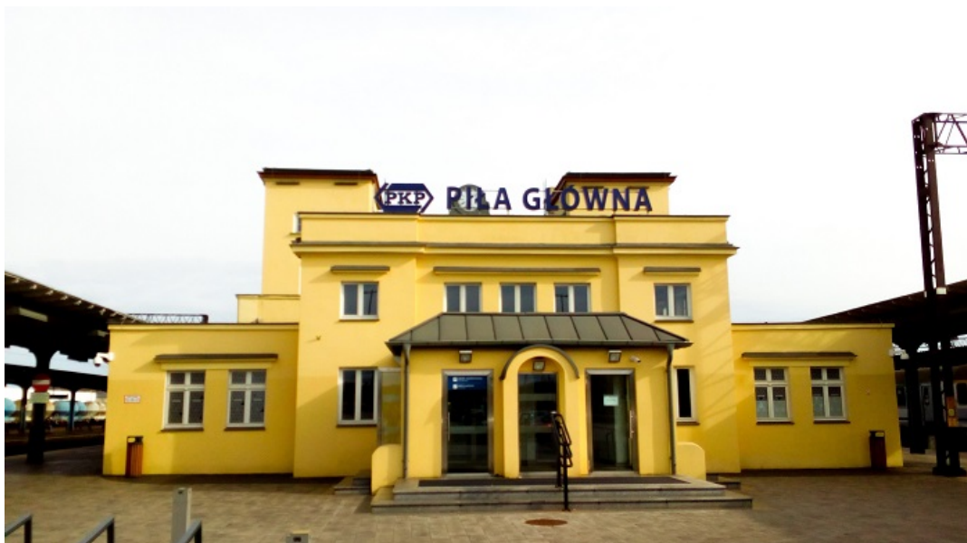
Główny budynek zabytkowego zespołu stacji kolejowej Piła Główna