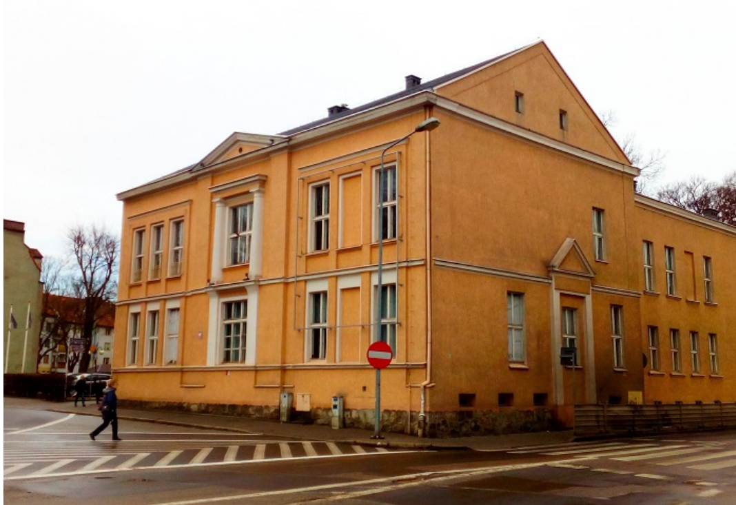
Dawna loża masońska. Obecnie siedziba filii Wyższej Szkoły Gospodarki w Bydgoszczy

wojny mieściła się w nim siedziba Liceum Medycznego, a w czasach późniejszych żłobek. W latach 90-tych w budynku mieściła się Wyższa Szkoła Biznesu w Pile.