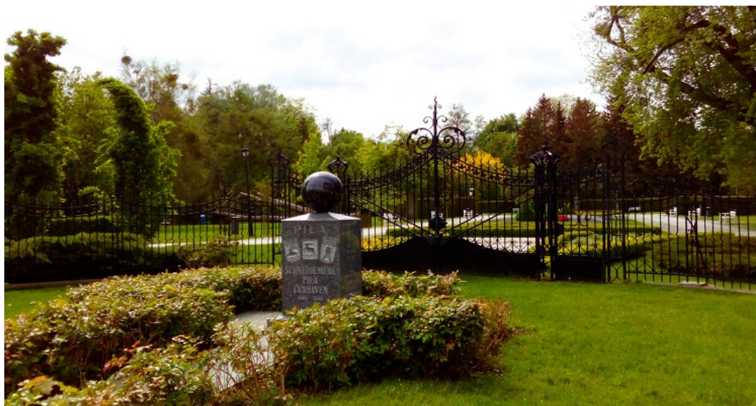
Park Miejski im. Stanisława Staszica. Widok od strony bramy głównej

Już w roku 1895 pilski magistrat zdecydował z kolei o utworzeniu parku miejskiego. Na jego lokalizację wybrano teren przylegający do Parku Strzeleckiego, a prace rozpoczęto w roku 1899. Istniejący już park miejski znacząco powiększono w latach 1927-1929, przyłączając do niego tereny sięgające aż do ulicy Dzieci Polskich. W burzliwym dla dziejów miasta roku 1945 spłonęła parkowa restauracja Kolonade, a po zakończeniu wojny oba parki zostały