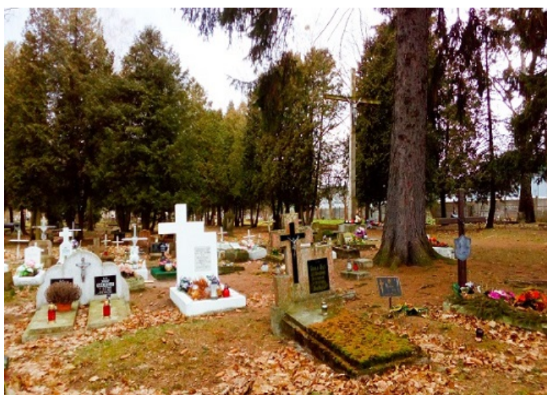
Cmentarz przy Al. Powstańców Wielkopolskich