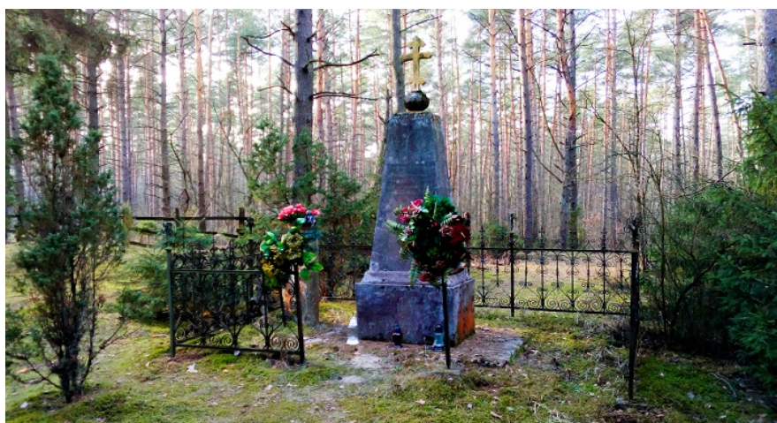
Monument na prawosławnym cmentarzu cholerycznym z okresu I wojny światowej