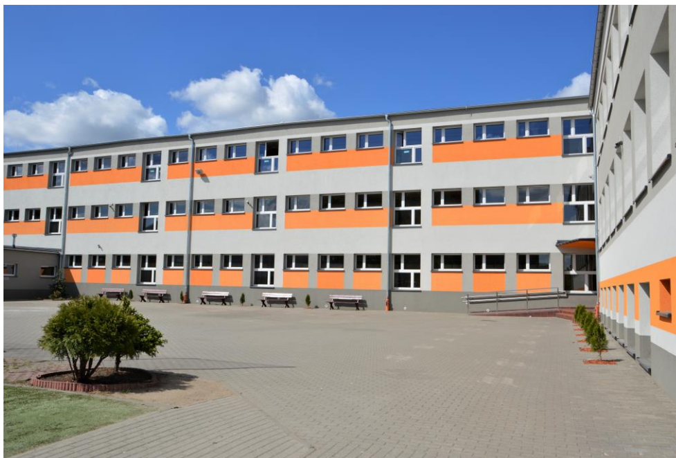
Termomodernizacja Publicznego Przedszkola nr 3 przy ul. Wincentego Pola w Pile. W

Termomodernizacja Szkoły Podstawowej nr 5 im. Dzieci Polskich w Pile – budynek przy ul. Kujawskiej 18. Zadanie, na realizację, którego pozyskano środki w ramach Programu Jessica 2 - Instrumenty Finansowe wdrażane w ramach Wielkopolskiego Programu Operacyjnego na lata 2014-2020, Osi Priorytetowej 3 – “Energia”, Działanie 3.2 – “Poprawa efektywności energetycznej w sektorze publicznym i mieszkaniowym”, Poddziałanie 3.2.2 “Kompleksowa modernizacja energetyczna budynków użyteczności publicznej i wielorodzinnych budynków mieszkalnych – instrumenty finansowe”. Zakres prac obejmował: wymianę okien i drzwi hali sportowej wraz z wymianą parapetów, ocieplenie stropodachu szkoły, małej sali sportowej, dużej sali gimnastycznej, ścian zewnętrznych oraz wykończenie lekkim tynkiem strukturalnym. Łączna wartość projektu 1 520 715 zł.