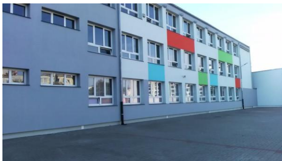
Szkoła Podstawowa nr 4:

Poniżej kilka zdjęć przedstawiających zakończone prace: