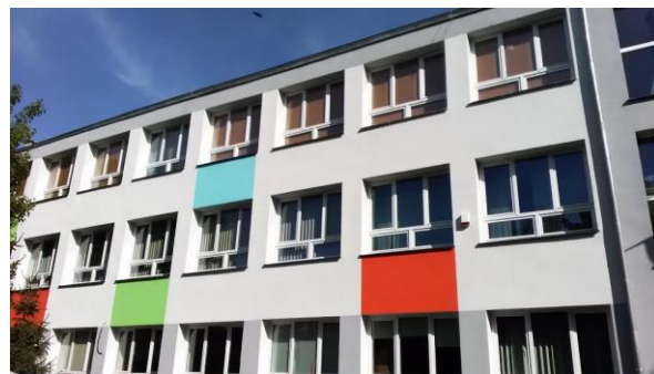
Publiczne Przedszkole nr 14: