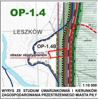
WYRYS ZE STUDIUM UWARUNKOWAŃ I KIERUNKÓW ZAGOSPODAROWANIA PRZESTRZENNEGO MIASTA PIŁY 1:10 000