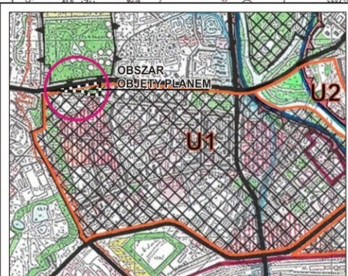
WYRYS ZE ZMIANY STUDIUM UWARUNKOWAŃ I KIERUNKÓW ZAGOSPODAROWANIA PRZESTRZENNEGO MIASTA PIŁY SKALA 1: 20 000