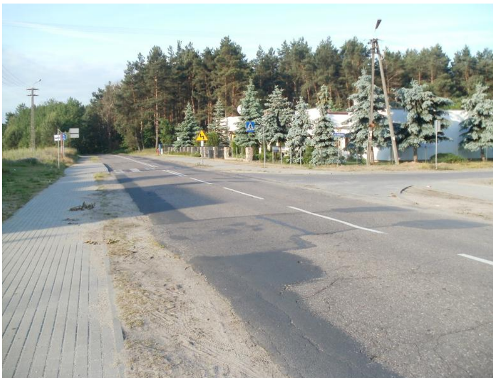
Fotografia NR 3 - ul. Kamienna – droga powiatowa