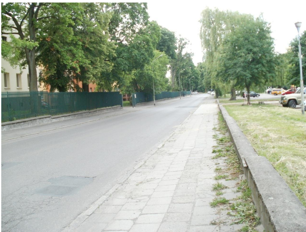
Fotografia NR 7 - ul. Podchorążych – droga powiatowa