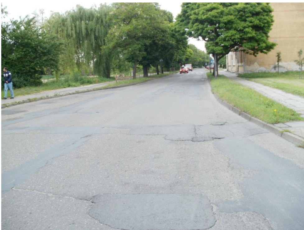
Fotografia NR 9 – ul. Walki Młodych – droga powiatowa