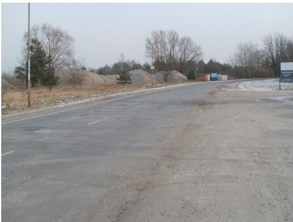
Fotografia NR 13 ul. Przemysłowa – droga gminna

- „ul. Przemysłowa – odcinek od ul. Motylewskiej do obwodnicy zewnętrznej” przygotowanie dokumentacji technicznej i uzyskanie pozwolenia na budowę,