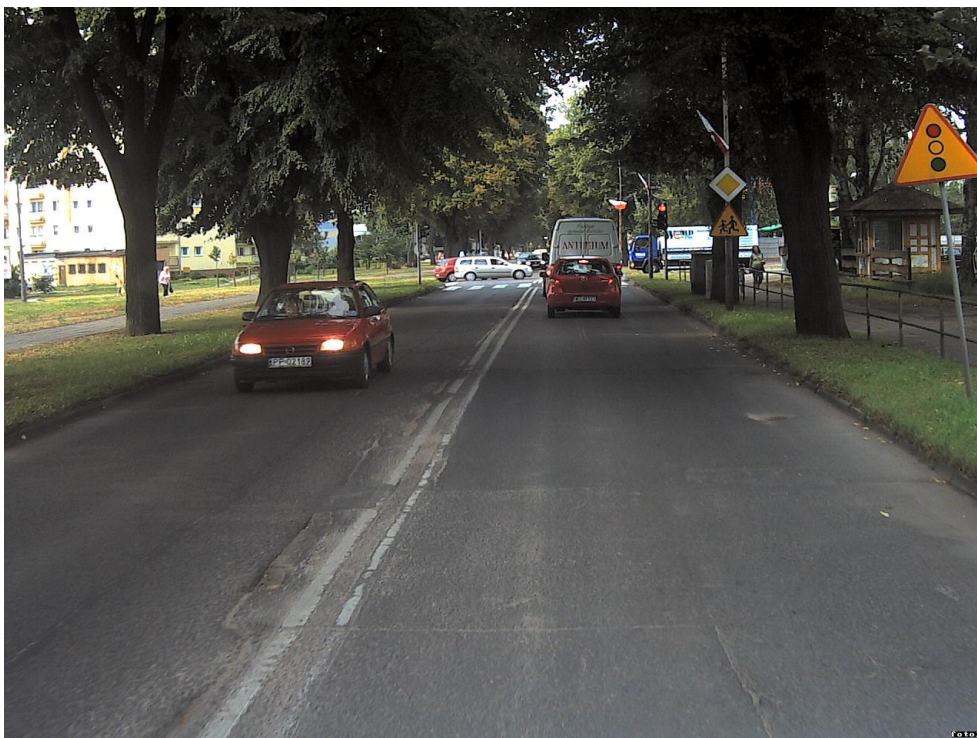
Fotografia NR 11 ul. Bydgoska – droga gminna