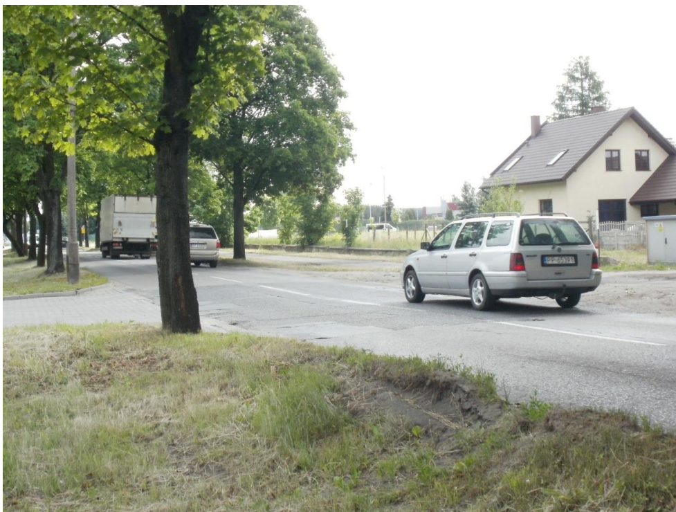
Fotografia NR 5 - ul. Kossaka – droga powiatowa