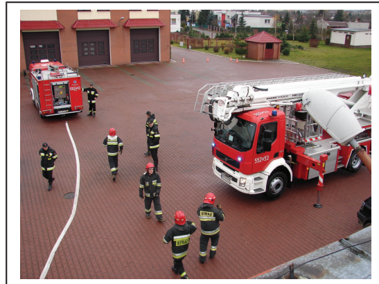
Fragmety kontroli gotowości bojowych.

W okresie sprawozdawczym przeprowadzono łącznie 45 kontroli gotowości bojowej w jednostkach ratowniczo gaśniczych, w tym;