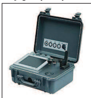
Przenośny spektrometr podczerwieni MOBILE IR