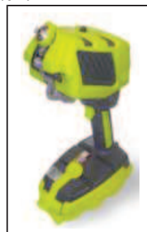
Spektrometr laserowy StreetLab Mobile