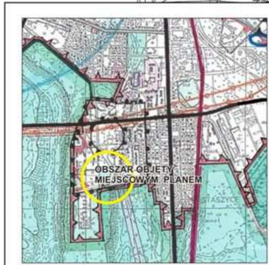
WYRYS ZE ZMIANY STUDIUM UWARUNKOWAŃ I KIERUNKÓW ZAGOSPODAROWANIA PRZESTRZENNEGO MIASTA PIŁY SKALA 1:20 000