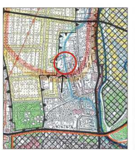
WYRYS ZE ZMIANY STUDIUM UWARUNKOWAN I KIERUNKÓW ZAGOSPODAROWANIA PRZESTRZENNEGO MIASTA PIŁY skala 1:20 000

ZALĄCZNIK NR 1 DO UCHWAŁY NR RADY MIASTA PIŁY Z DNIA